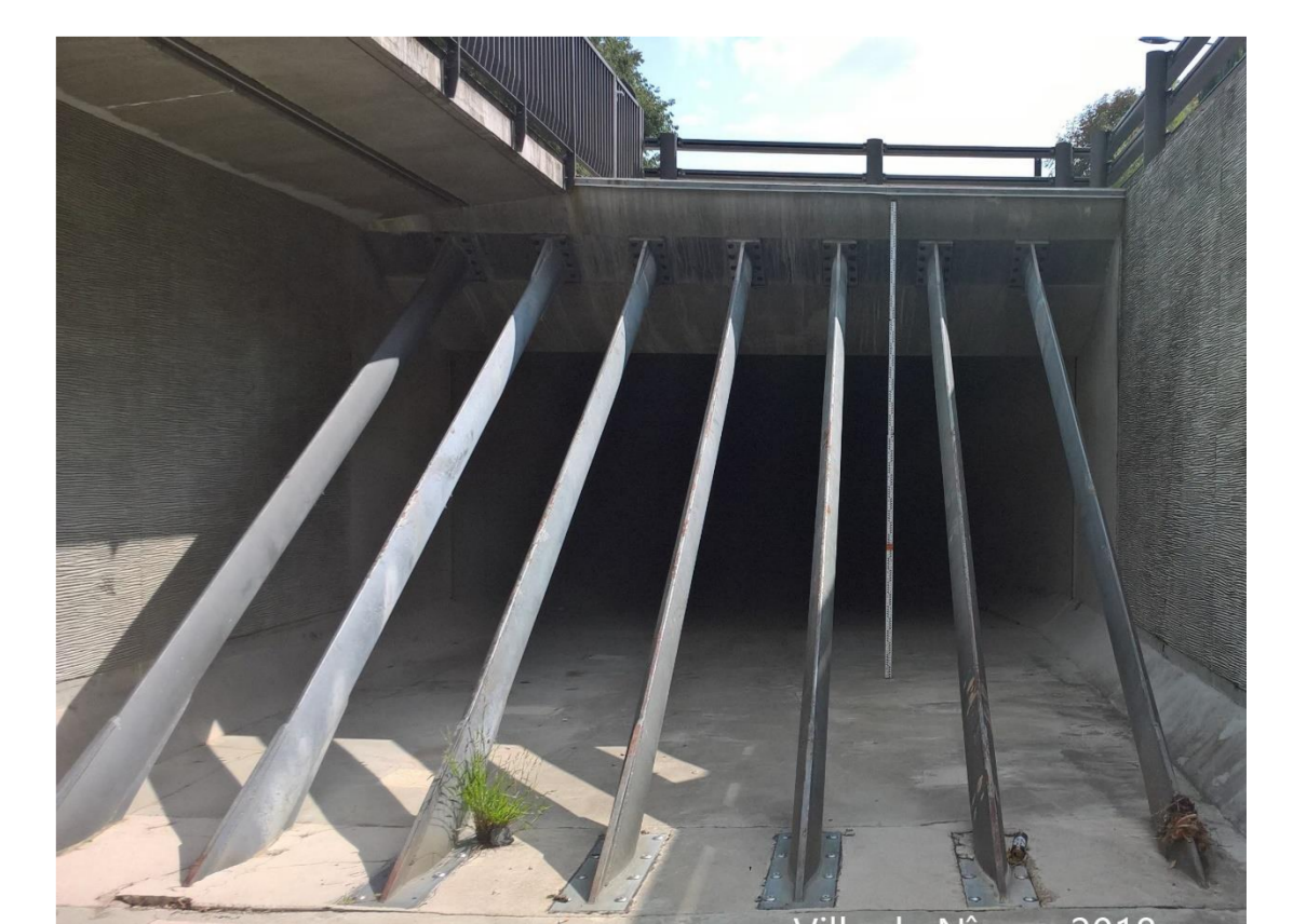
Image : Cadreaux de Nîmes au site de cimetière protestant pendant l'évènement de crue du 10 Octobre 2014 (à gauche) et sans évènement de crue (à droite).