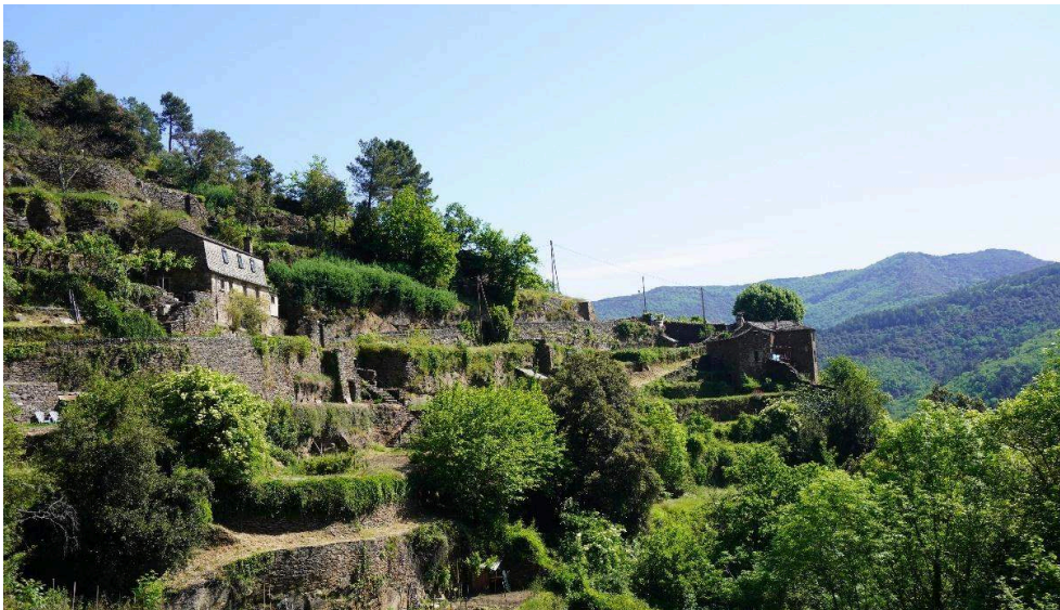
Figure 4 : photographie d'un « quartier » de Saint-Germain-de-Calberte, composé de bancels