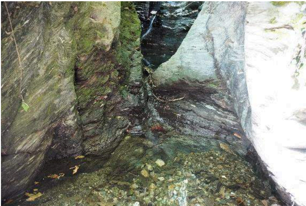
Figure 6 : photo de la nappe libre sur le terrain d'atterrissage