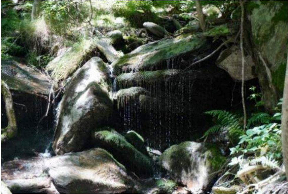
Figure 5 : photo d'une cascade en frange sur le terrain d'atterrissage