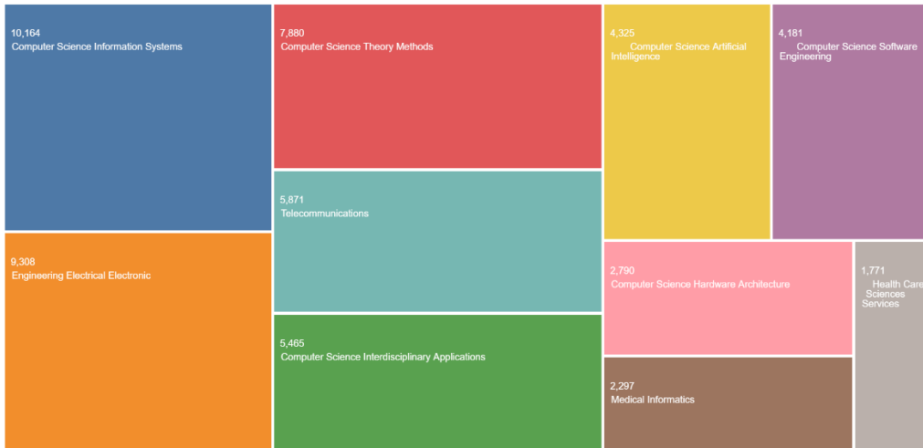
Figure 2 - Répartition des publications sur l'interopérabilité par champs de recherche

En 2023, l'état de l'art de la littérature scientifique internationale sur le sujet de l'interopérabilité témoigne d'une prédominance des travaux en matière d'informatique, d'ingénierie système et de télécommunication. L'interopérabilité est avant tout un enjeu critique pour mettre en capacité les systèmes d'information à rendre compatibles leurs interfaces et normes de fonctionnement. Le nombre des publications scientifiques sur le sujet a considérablement augmenté à partir des années 2010. Les articles les plus cités portent, par exemple, sur une suite intégrée de codes informatiques, indépendants et interopérables, dans une logique de source ouverte encourageant les chercheurs à coconstruire des codes existants (Giannozzi et al. , 2009), ou encore sur une bibliothèque de programmation de vecteurs, de matrices et de tableaux jouant un rôle de couche d'interopérabilité flexible pour soutenir l'analyse scientifique et industrielle (Harris et al. , 2020).