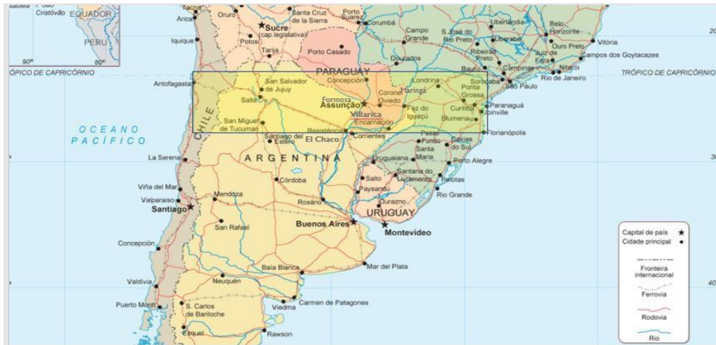
Figure 1 – Région de l'axe Capricorne en Amérique Latine