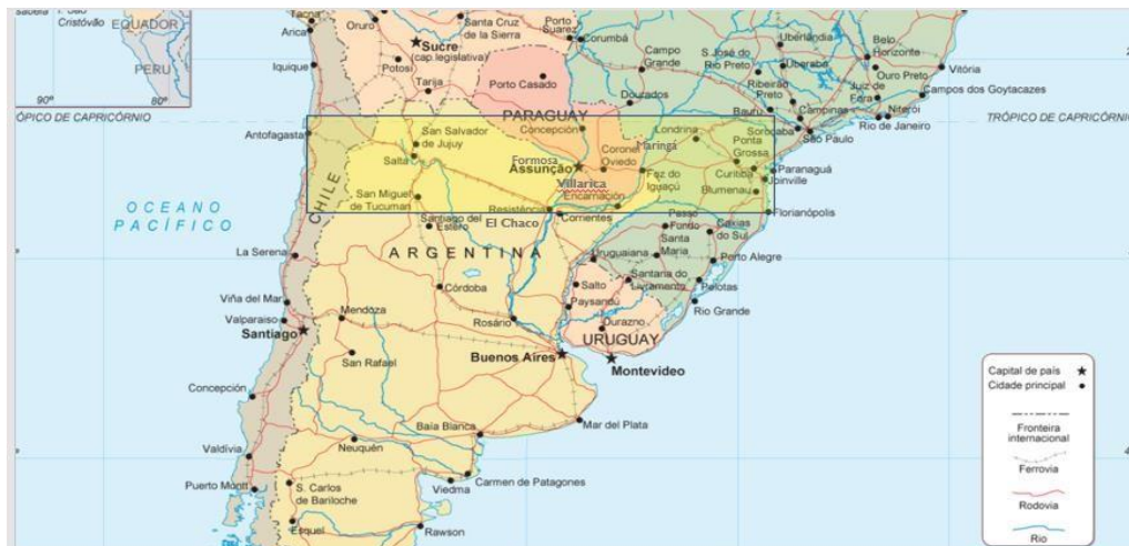
Figure 1 – Région de l'axe Capricorne en Amérique Latine