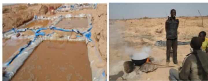
Bassins de cyanuration, site de Nbganga, Niger