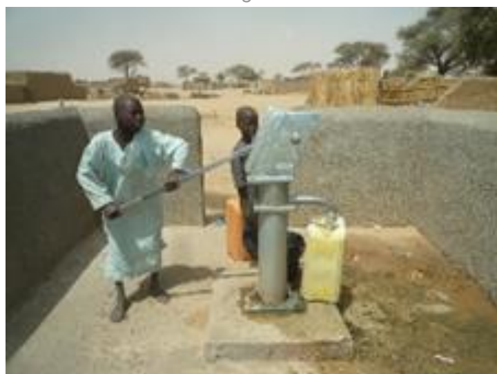
Borne fontaine des villages environnants