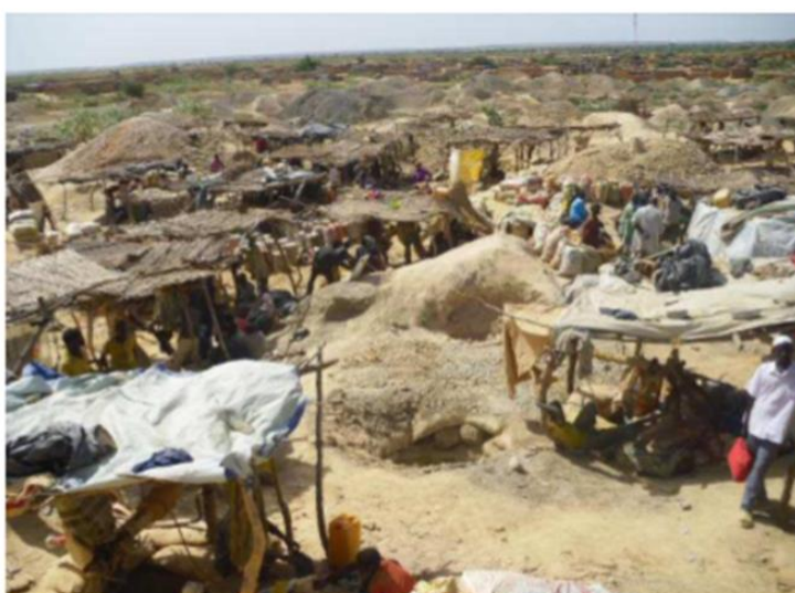
Vue d'un site aurifère de Komabangou en 2014 au Niger