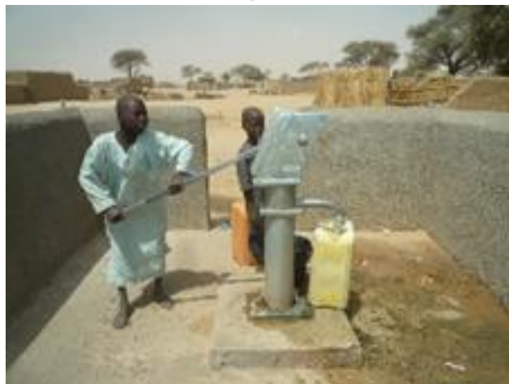
Borne fontaine des villages environnants